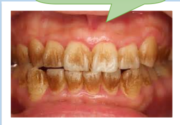
ステインが付着した歯

特に歯ブラシによる清掃が困難な部分では、歯の表面の繊細な凹凸に色素が徐々に付着することによって、ステインの付着が起こります。ステインの付着を起こしやすい飲食物には、ポリフェノール的一种であるタンニンを含む赤ワイン、紅茶、コーヒーなどが挙げられています。その他の着色の原因には、タバコに含まれるヤニの沈着や抗菌剤であるグルコン酸クロルヘキシジンを含む洗口剤の長期使用によるものがあります。